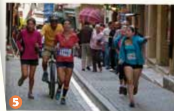
5 Au pas de charge