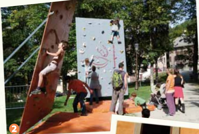
2 La ville qui grimpe... partout !