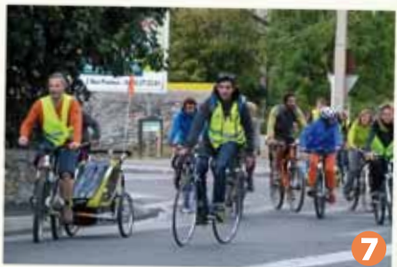
7 Vive la Vélorution !