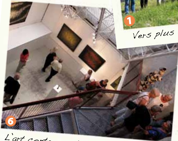
6 L'art contemporain déplace les foules