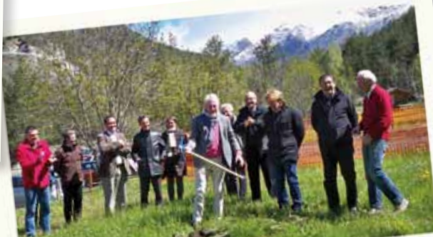
1 Vers plus d'autonomie énergétique