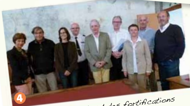
4 L'Europe au chevet des fortifications