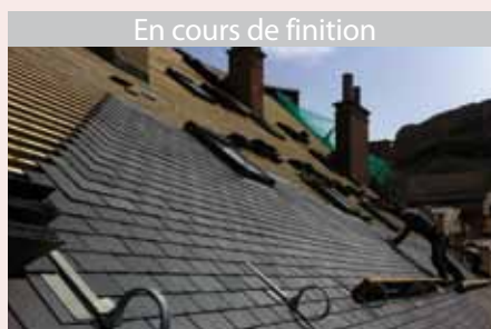
En cours de finition