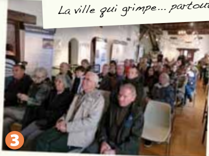
3 Bienvenue à Briançon !